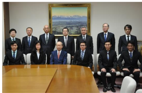
受入企業のみなさんと第1期生が 知事を表敬訪問(H28.4.21)

留学生には、当社とアセアン地域との関係だけでなく、富山県とアセアン地域の架け橋として、活躍して欲しい。