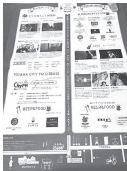
ビアライブパンフレット(パンフレット)

【事業・活動 実現のキーファクター】コンテンツへの徹底した拘りと自主製作映画等地域に関連した作品・アーティストの選定、隣接組織との連携、回遊性の創出。