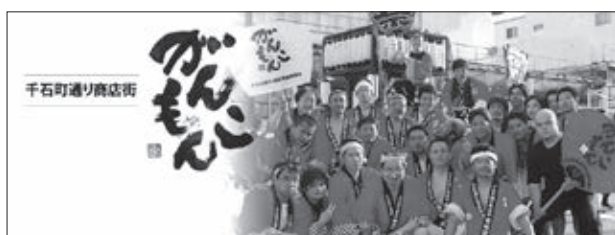
千石町商店街(がんこもん)

イベントは盛況であり、これまで以上の賑わいを創出。共催という形を採ったことで内容も充実し、当日の賑わいだけでなく千石町通り商店街をPRすることができた。提供するクラフトビールの商品選び、ライブ演奏・上映映画の自主製作を含め地域に関わりのあるアーティスト・作品を採用した点等コンテンツに拘った点があげられる。