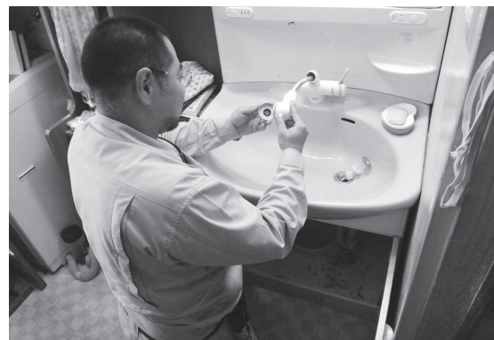
青年部の「水回りの困りごと相談」