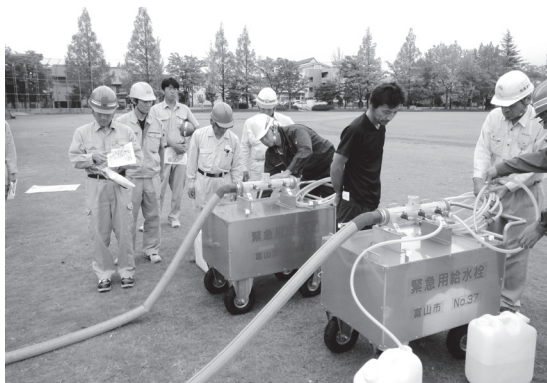
耐震性緊急貯水槽の点検・訓練