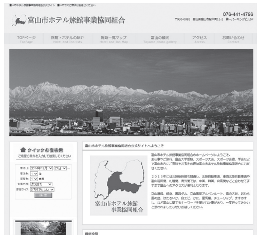
組合ホームページトップ

インターネットから予約ができにくい団体客には組合のホームページが有効に活用され、繁忙期の 8 月や「おわら風の盆」時のアクセスは非常に多い。組合ホームページの制作・運用に合わせて、今までホームページを制作していなかった小規模旅館などが自社ホームページを制作するようになり、またブログ等でも、より詳細な情報を発信できるようになった。